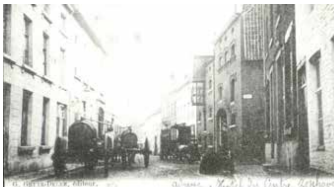
De stokerijen zorgden voor veel bedrijvigheid in de Paardsdemerstraat, ca. 1900 (privécollectie)

Op nummer 11 zien we huis 'De Wolf'. Het is een mooi voorbeeld van industriële architectuur, met een 17de-eeuwse kern. Het was het woonhuis van een groot stokerij- en mouterijcomplex. Door de jaren heen had het pand verschillende eigenaars. Vanaf de jaren 1930 werd het eigendom van de gebroeders Smeets die het nadien verbouwden.