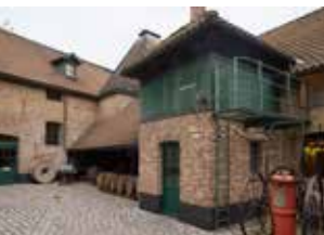
Binnenkoer van het Jenevermuseum

Specifieke onderwerpen worden uitgespit in tijdelijke tentoonstellingen, regelmatig opent de museumpoort zich voor evenementen en workshops, en in het proeflokaal kun je terecht voor empirisch onderzoek. Het museum is er zeker 'eentje om bij te leren!'