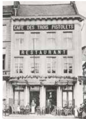
De Dry Pistolen, ca. 1920 (privécollectie)

Misschien verwacht je hier dan ook wat vechtpartijen met pistolen? Vergis je niet! Want in tegenstelling tot wat je waarschijnlijk vermoedt, is de naam 'De Dry Pistolen' niet afgeleid van vuurwapens, maar wel van de 'pistola', een Spaanse munt. Drie pistola's was de prijs voor een rijkelijke maaltijd. Later verdween deze betekenis, zodat op het gevelteken uit 1730 drie pistolen afgebeeld staan.