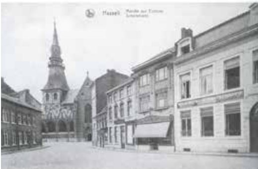
Huizenrij vanaf de Sint-Franciscus tot aan 'Den Oliphant', ca. 1900

In de buurt, op nummer 45, lag nog een likeurfabriek: Vanschoonbeek. Rond 1920 opende de Diesterse familie Vanschoonbeek in dit huis een winkel in snoep, wijnen en likeuren. Vanaf 1924 versneden ze zelf alcoholische dranken onder de merknaam 'Ajax'. Eind jaren 1930 stopte de productie.