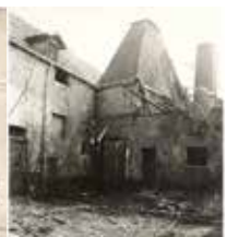
De binnenkoer van stokerij Theunissen, maart 1984