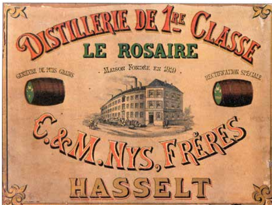
Affiche voor stokerij Nys, met in het midden zicht op het stokerijcomplex op de hoek van de Meldertstraat en de Zuivelmarkt, ca. 1880-1890