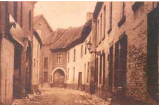
Het huis De Rosemarynboom (Botermarkt 26) werd eind 19de eeuw samengevoegd met stokerij La Fortune (Demerstraat) van Vinckenbosch. De stokerij liep zo van de Demerstraat tot de Raamstraat, waar zich de stallen bevonden. De restanten van de stallen zie je nog in de Raamstraat 4.