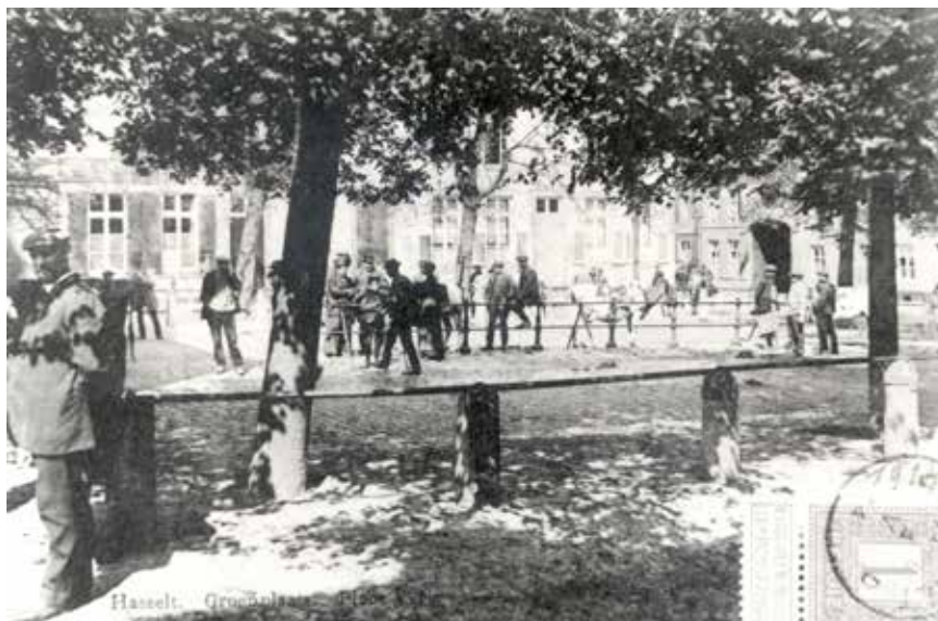
Groenplein, rond 1910