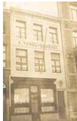
Likeurfabriek Van Schoonbeek, ca. 1925