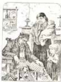
La Femme du Buveur :

« Mon cher, le soir à 60 cent, demain nous allons faire un voyage de plaisir... »