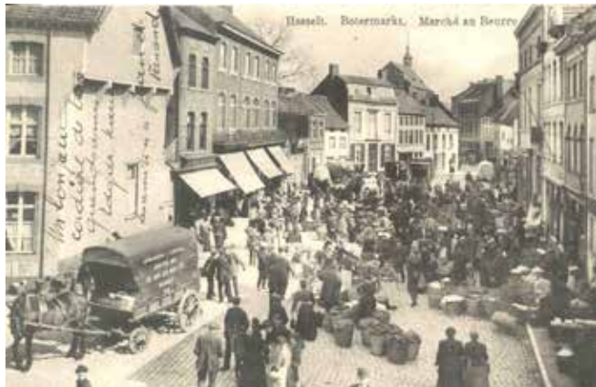
Zicht op de Zuivelmarkt met links De Dry Dragonders, ca. 1890. Op het einde van de markt, rechts, zie je de gebouwen van stokerij Nys (privécollectie)

Het huis De Rosemarynboom (Botermarkt 26) werd eind 19de eeuw samengevoegd met stokerij La Fortune (Demerstraat) van Vinckenbosch. De stokerij liep zo van de Demerstraat tot de Raamstraat, waar zich de stallen bevonden. De restanten van de stallen zie je nog in de Raamstraat 4.