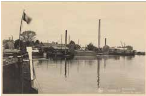
Kanaalkom met zicht op de gelatinefabriek, ca. 1930 (collectie SAH)

Vandaag biedt het Volkstehuis onderdak aan volwassen mannen zonder verblijfplaats.