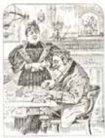
La Femme du Cabaretier :