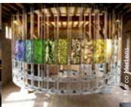
Ruiken en voelen in het Jenevermuseum